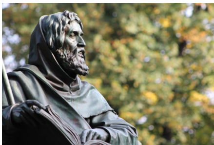
Monumento a Pedro Valdo, en Worms (Alemania)

A pesar de ello, persistieron en su vida de pobreza y su predicación. Durante algún tiempo se esparcieron por diversas ciudades. Pero a la postre la persecución fue tal que se vieron obligados a refugiarse en los valles más retirados de los Alpes. Allí se les reunieron poco después los restos del movimiento de los “pobres lombardos”, muy semejante al de los valdenses, y también perseguido por la jerarquía eclesiástica. Debido a su historia, quienes se refugiaron en aquellos escondites no sentían aprecio alguno hacia Roma y el resto de la jerarquía eclesiástica. Sus seguidores, conocidos como los valdenses, creían que la Biblia era la única fuente de autoridad y rechazaban la organización y muchas de las prácticas de la Iglesia Romana.