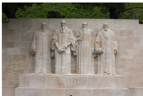
Monumento a los reformadores, en Ginebra (Suiza)

El 31 de octubre de 2017 se celebrará el quinto centenario de la Reforma Protestante iniciada por Martín Lutero. Dicho así tal parece que el proceso reformador de la iglesia comenzó en el momento que Lutero clava sus 95 tesis en su iglesia en Wittemberg. Pero tal cosa no es cierta. La reforma del siglo XVI no fue el trabajo de un solo hombre, sino de muchos hombres y mujeres que Dios levantó en diferentes lugares con la visión de retornar a la práctica de la vida cristiana según la verdad de las Escrituras. Fue obra de Dios por la que las circunstancias y el corazón de los hombres fueron preparados para trasladar al mundo de las tinieblas de la religión falsa, a la luz del evangelio de la gracia bajo la autoridad de las sagradas Escrituras. Es de justicia dar a conocer a algunos de los principales precursores de la Reforma, que sufrieron persecución, torturas y muerte por causa de su propósito de regresar al verdadero evangelio de Jesucristo. Comenzamos una breve serie de cortas biografías de algunos de aquellos hombres de Dios, que son parte de esa “gran nube de testigos” que nos han precedido. Los datos biográficos han sido tomados de varias fuentes, principalmente de la obra “Historia del Cristianismo” del teólogo e historiador Justo González García.