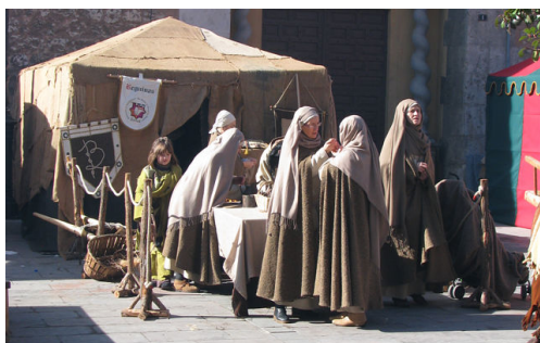
Representación teatral y actual de las beguinas