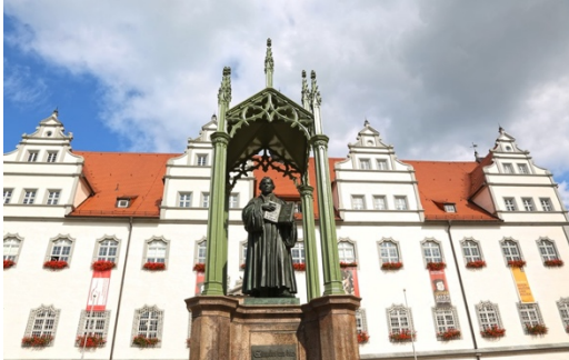
Monumento a Lutero en Wittenberg (Alemania)

Las 95 tesis de Lutero y la crisis del poder de su época