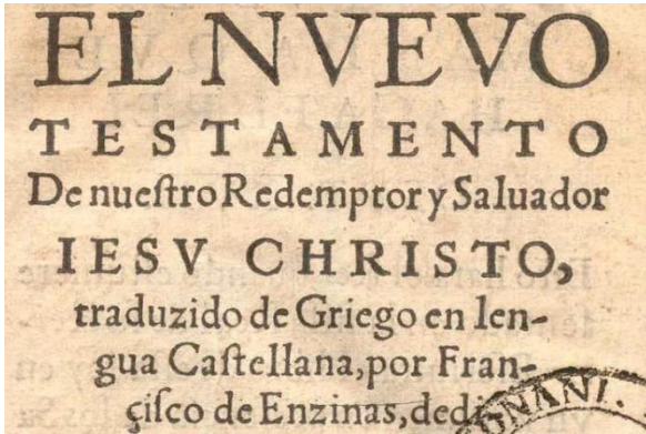
Porción del frontispicio original (página anterior a la portada) del Nuevo Testamento de Enzinas

1539. En la universidad conoce los escritos de Felipe Melanchthon y visitó frecuentemente a su compatriota, el mercader Francisco San Román, primer mártir del Protestantismo español. En octubre de 1541 se matriculó en la Universidad de Wittenberg y continuó sus estudios de griego con Melanchthon. Enzinas había empezado su traducción al castellano del Nuevo Testamento en Lovaina, y en Wittenberg este proyecto recibió el apoyo de Melanchthon, en cuya casa se hospedaba Enzinas.