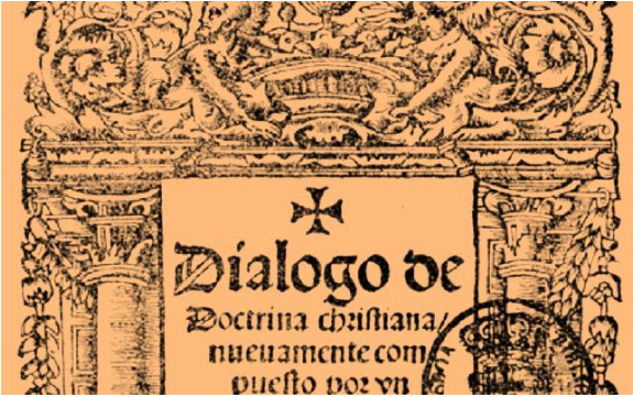
Porción del frontispicio original del “Diálogo de doctrina cristiana”, escrito por Valdés